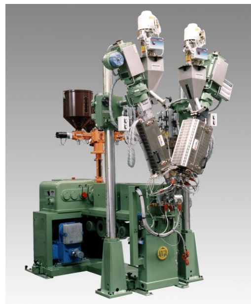
Инновации – неотъемлемая часть экструзионных разработок компании Cerrini

Инновации занимают ключевые позиции при разработке оборудования и технологического процесса, и компания Cerrini всегда идет в ногу с современными технологиями, поддерживая темпы рыночного спроса.